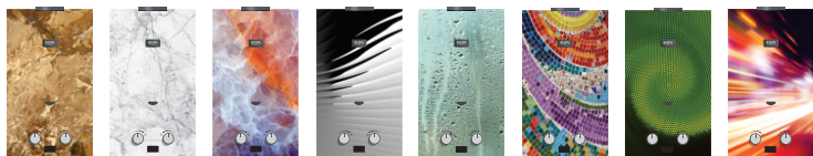
RGN01-20 RGN01-20T RGN02-20 RGN02-20T RGN03-20 RGN03-20T RGN04-20 RGN04-20T RGN05-20 RGN05-20T RGN06-20 RGN06-20T RGN07-20 RGN07-20T RGN08-20 RGN08-20T